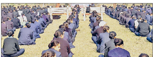
फतेहाबाद। योगाभ्यास करते हुए शहीद बाबा दीप सिंह नर्सिंग कॉलेज के विद्यार्थी।