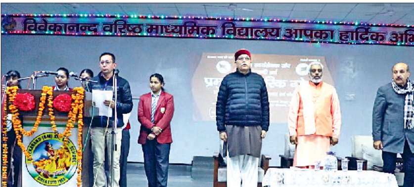
सिरसा। राष्ट्रीय स्वयं सेवक संघ के शताब्दी वर्ष के कार्यक्रम में उपस्थित लोग।