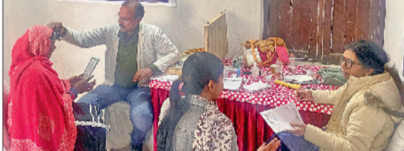
सिरसा। मरीजों की जांच करते हुए चिकित्सक।