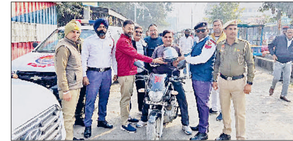
रतिया। लोगों को हेलमेट वितरित करते क्लब सदस्य व ट्रैफिक पुलिस कर्मचारी।