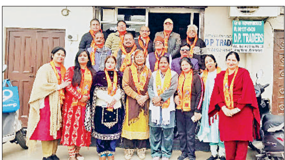
फतेहाबाद। ऑल इंडिया अरोड़ा खत्री पंजाबी कम्युनिटी की महिला विंग कार्यकारिणी।

ऑल इंडिया अरोड़ा खत्री पंजाबी कम्युनिटी महिला विंग की जिला व फतेहाबाद विस कार्यकारिणी घोषित