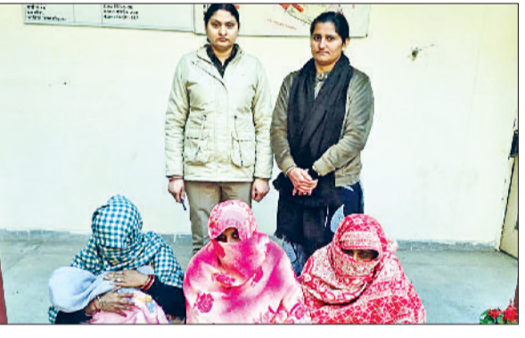
टोहाना। दुकान में चोरी करते पकड़ी गई महिलाएं।

जिले के शहर टोहाना में गांधी गेट स्थित एक दुकान से पकड़े चुराने का प्रयास करने का समाचार है। 4-5 महिलाएं बच्चों के साथ सामान खरीदने के बहाने दुकान में घुसी और कपड़े चोरी करने की कोशिश की। दुकानदार ने मौके से तीन महिलाओं को पकड़ लिया। इस बारे में सूचना मिलते ही पुलिस टीम मौके पर पहुंच गई और इन तीनों को हिरासत में लेकर पूछताछ शुरू कर